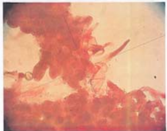
Cystides de la cuticule