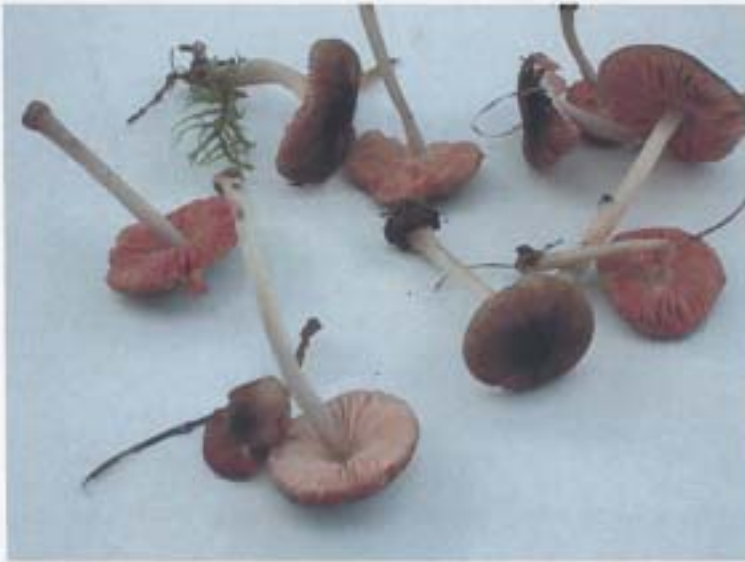
Pluteus podospileus fo. minutissimus (Maire) Vellinga