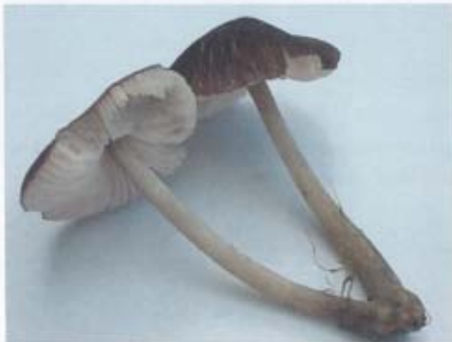
Pluteus podospileus Saccardo & Cuboni