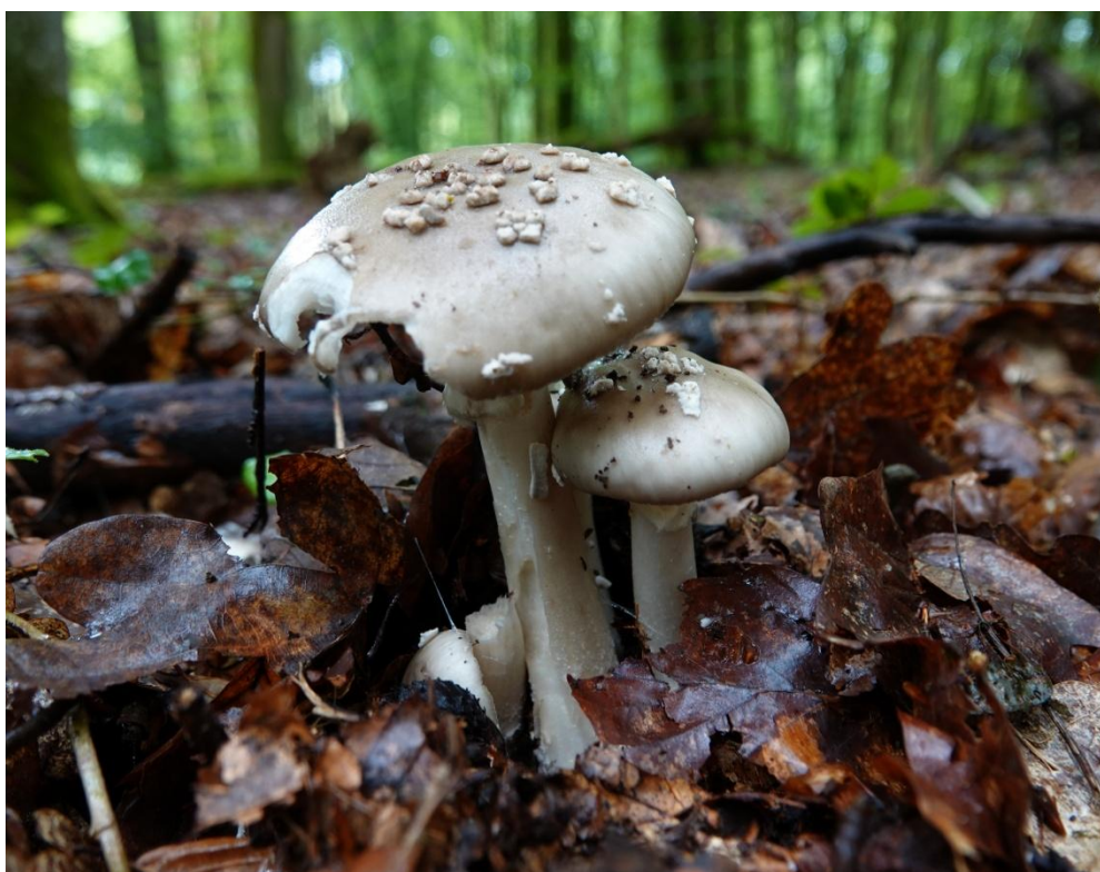
Amanita excelsa (Fr.) Bertill., 1866 Amanite élevée - Amanitales - Amanitaceae