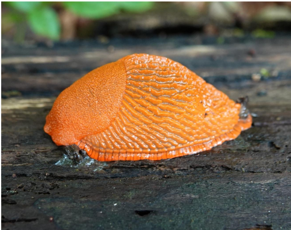
Arion rufus (Linnaeus, 1758) Grande loche - Stylommatophora - Arionidae