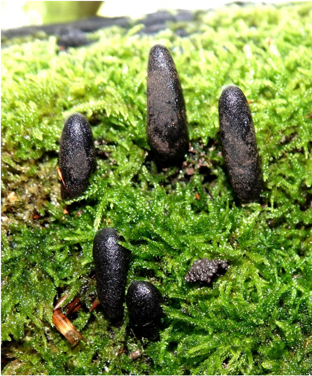
Xylaria polymorpha (Pers.) Grev., 1824 Xylaire polymorphe - Doigt de Satan - Doigt du mort Xylariales - Xylariaceae