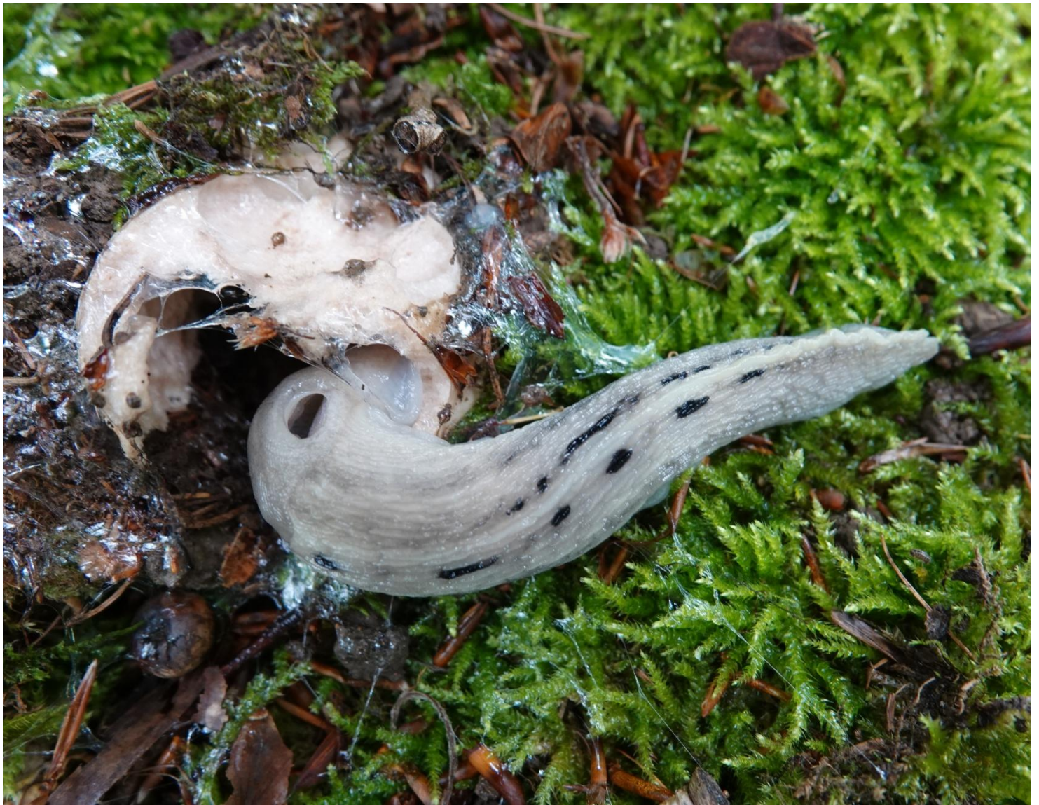
Limax cinereoniger Wolf, 1803 Grande limace - Stylommatophora - Limacidae