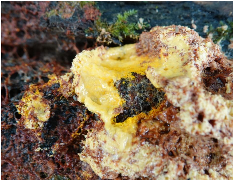
Fuligo septica (L.) F.H. Wigg., 1780 Fleur de tan - Physarales - Physaraceae