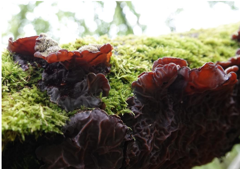
Auricularia mesenterica (Dicks.) Pers., 1822 Oreille poilue - Auriculariales - Auriculariaceae