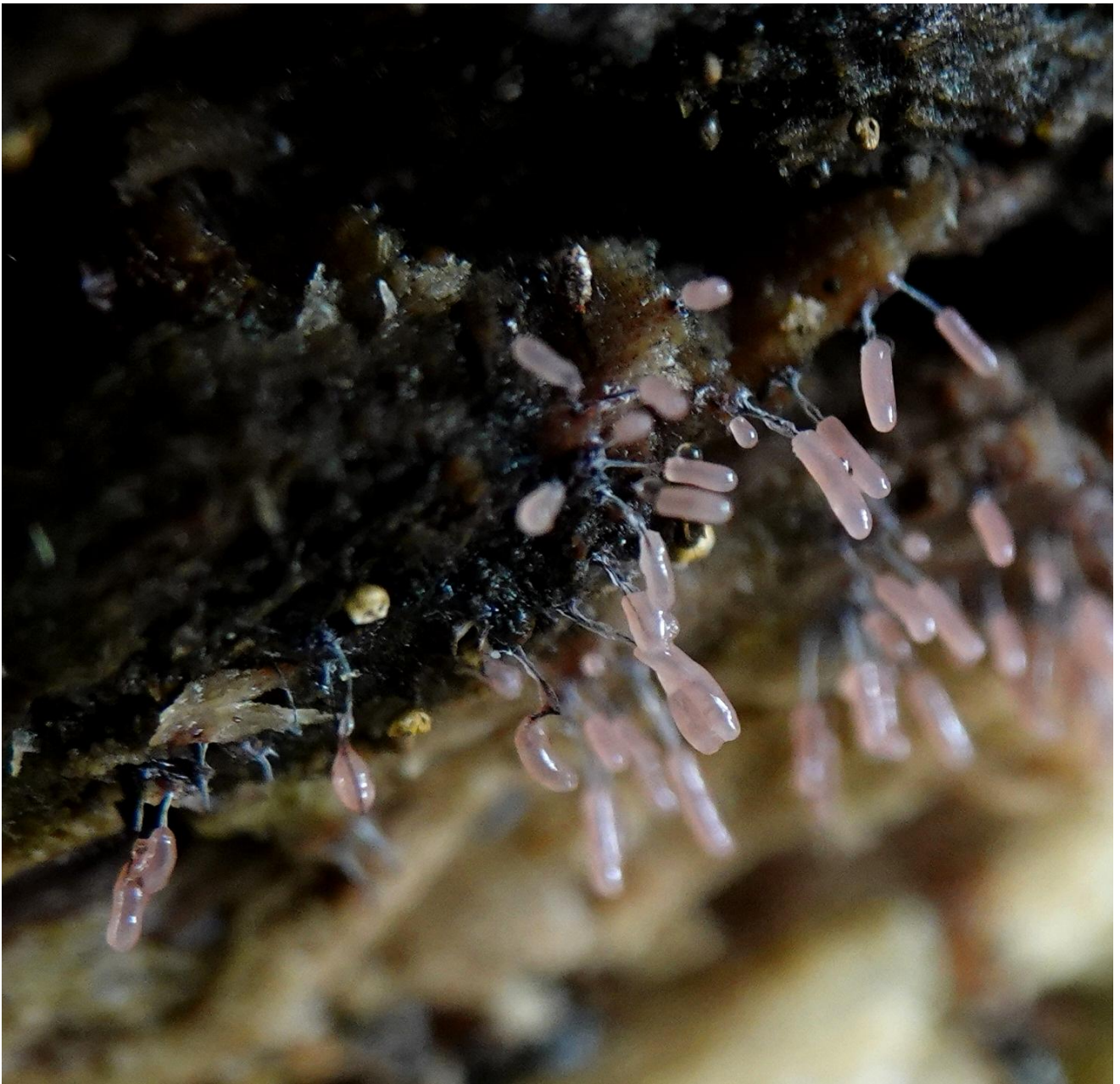
Stemonitopsis cf typhina - Stemonitales - Stemonitidaceae