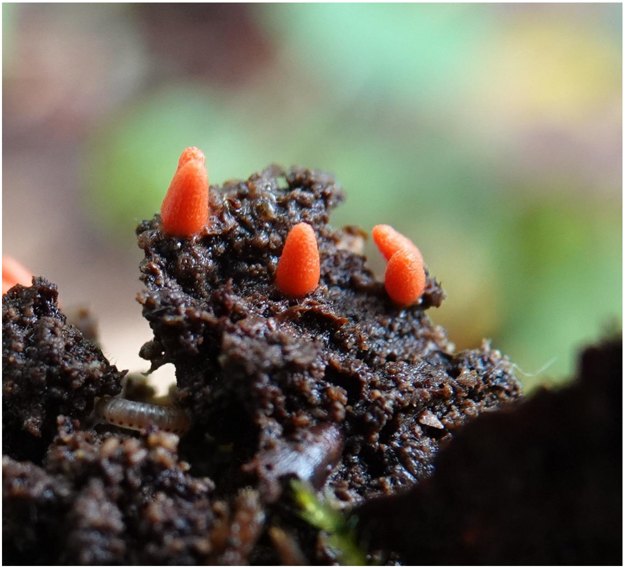
Lycogala conicum Pers., 1801 - Liceales - Reticulariaceae