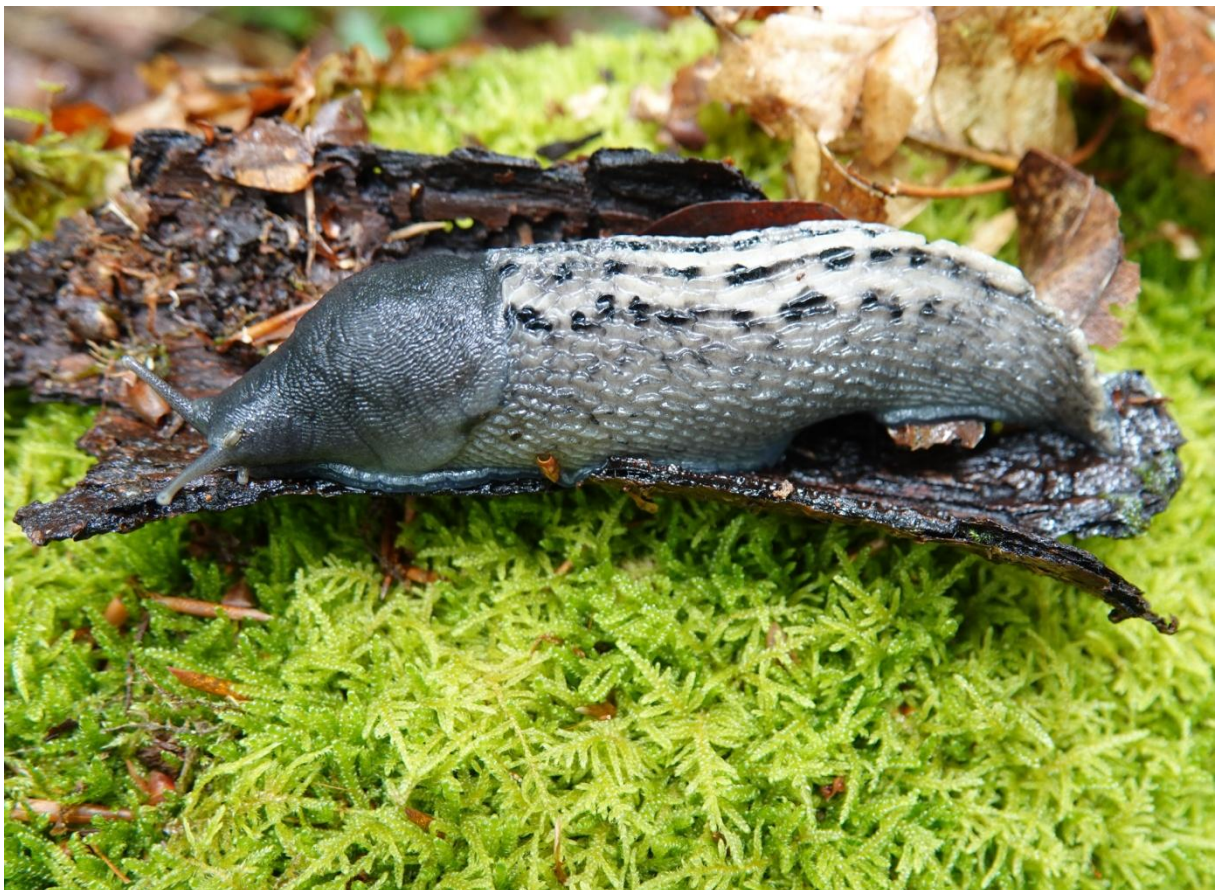
Limax cinereoniger Wolf, 1803 Grande limace - Stylommatophora - Limacidae