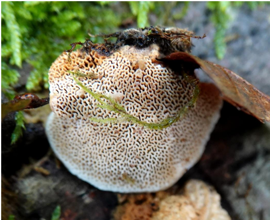
Antrodia serialis (Fr.) Donk, 1966 - Polyporales - Meripilaceae