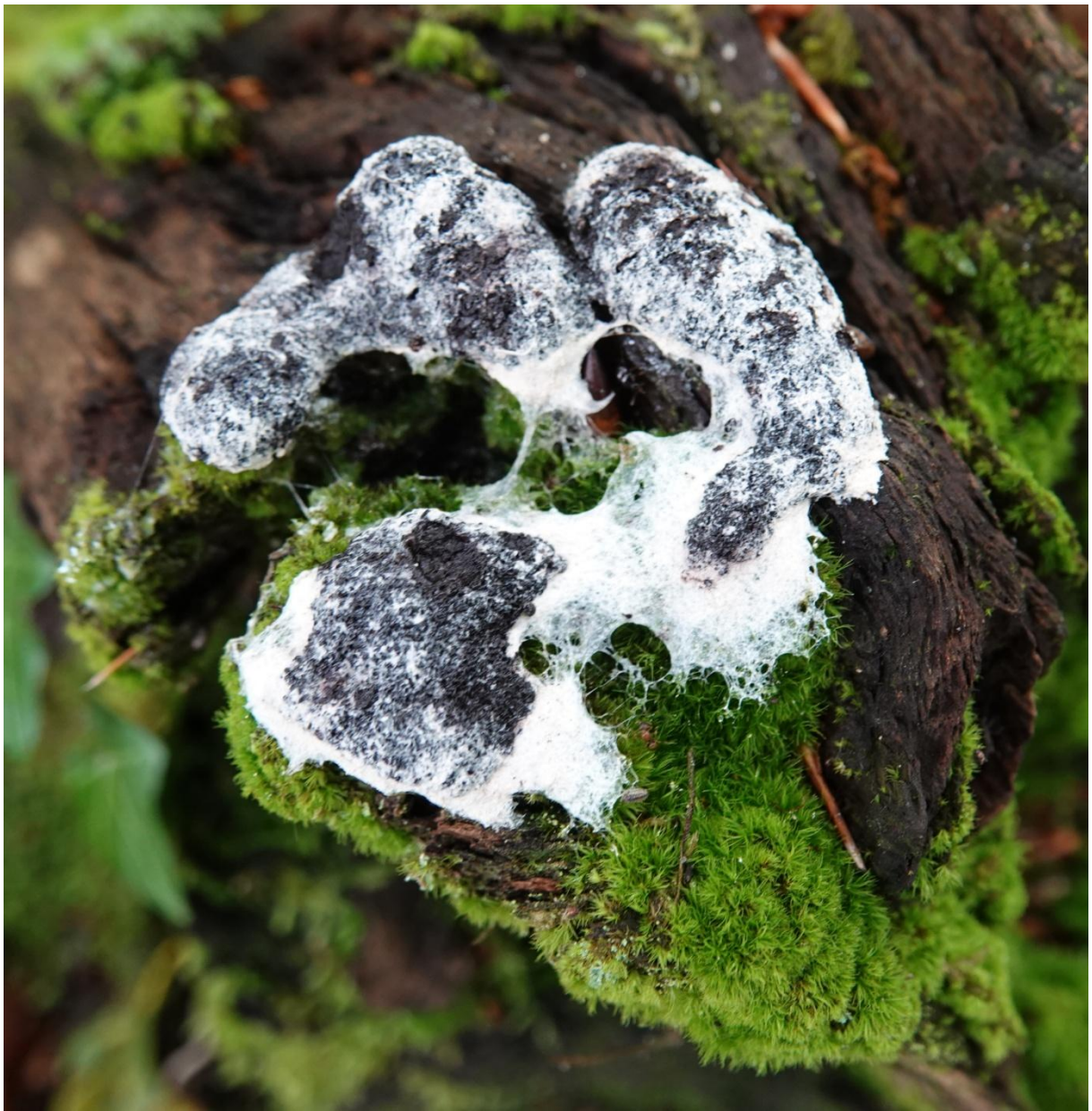
Fuligo septica var. candida (Pers.) R.E. Fr., 1912 - Physarales - Physaraceae