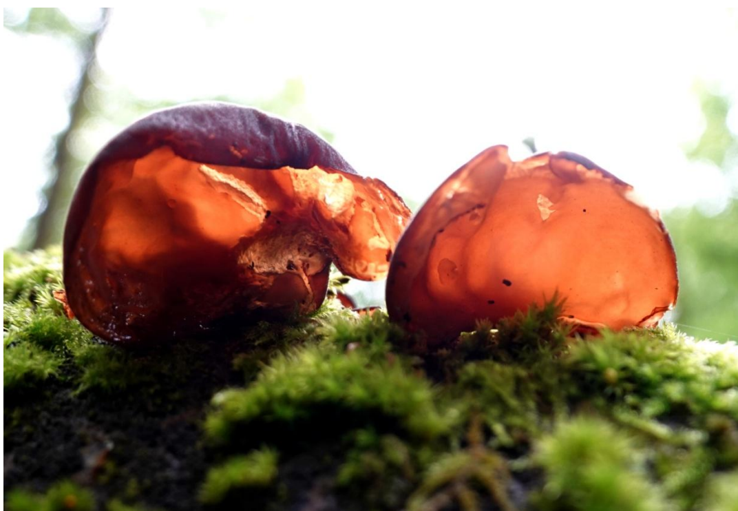
Auricularia auricula-judae (Bull.) Quéél., 1886 Oreille de Judas - Auriculariales - Auriculariaceae