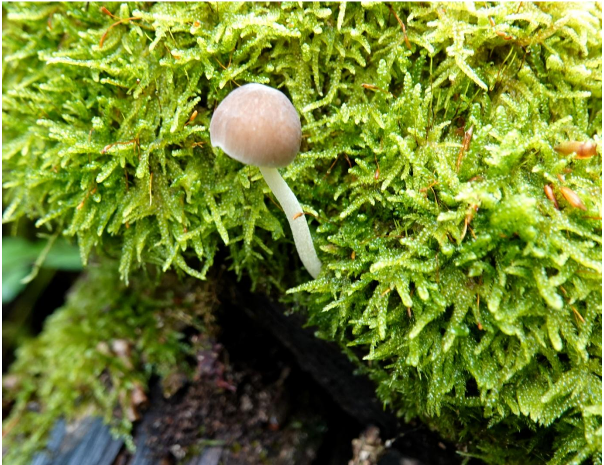
Pluteus phlebophorus (Ditmar) P. Kumm., 1871 Plutée veiné - Pluteales - Pluteaceae