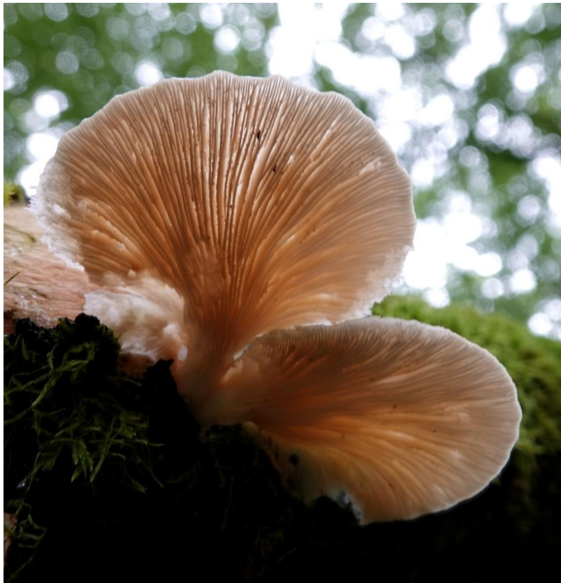
Pleurotus pulmonarius (Fr.) Quél., 1872 Pleurote pulmonaire - Tricholomatales - Pleurotaceae