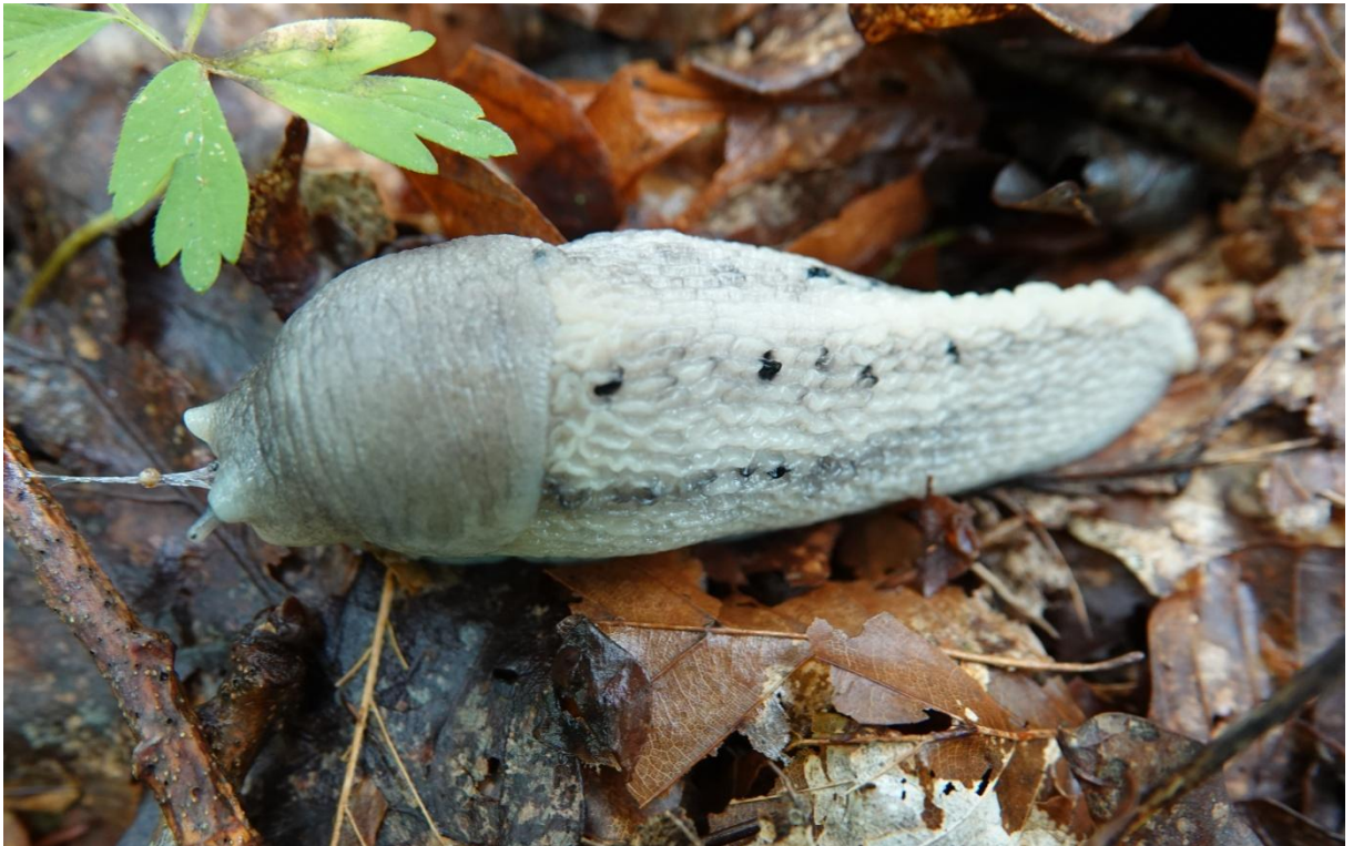
Limax cinereoniger Wolf, 1803 Grande limace - Stylommatophora - Limacidae