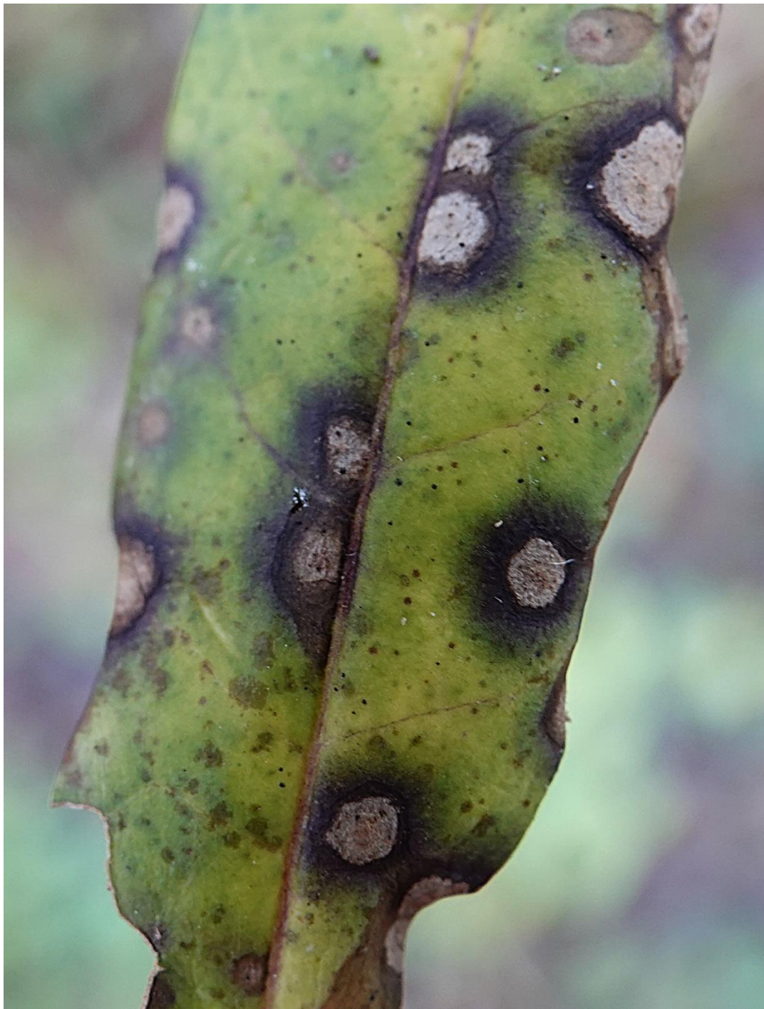
Cercospora ligustrina Boerema, 1962 Synonyme : Thedgonia ligustrina (Boerema) B. Sutton, 1973 Capnodiales - Mycosphaerellaceae