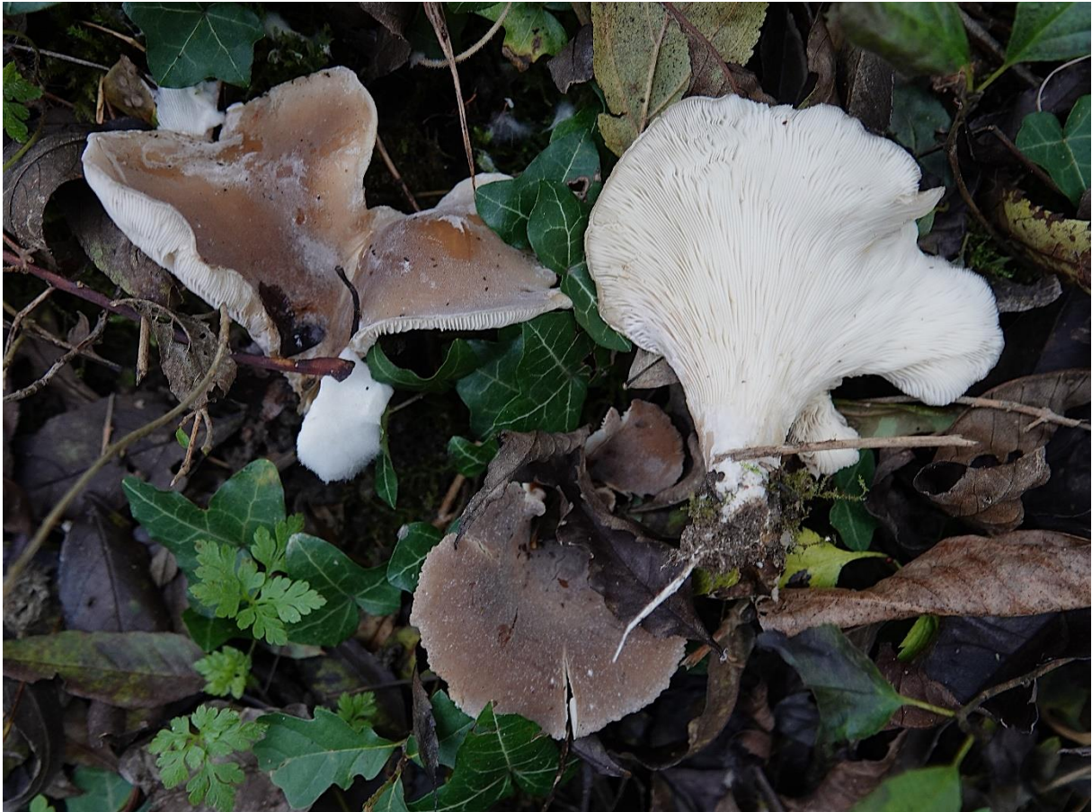
Hohenbuehelia geogenia (DC.) Singer, 1951 Pleurote terrestre - Tricholomatales - Pleurotaceae