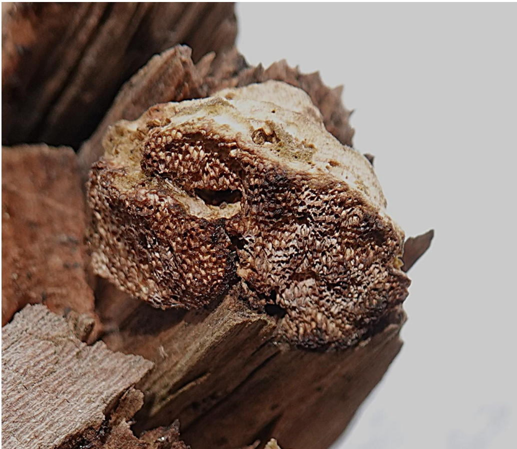
Funalia trogii (Berk.) Bondartsev & Singer, 1941 Synonyme : Coriopsis trogii (Berk.) Domański, 1974 Tramète du peuplier - Polyporales - Polyporaceae