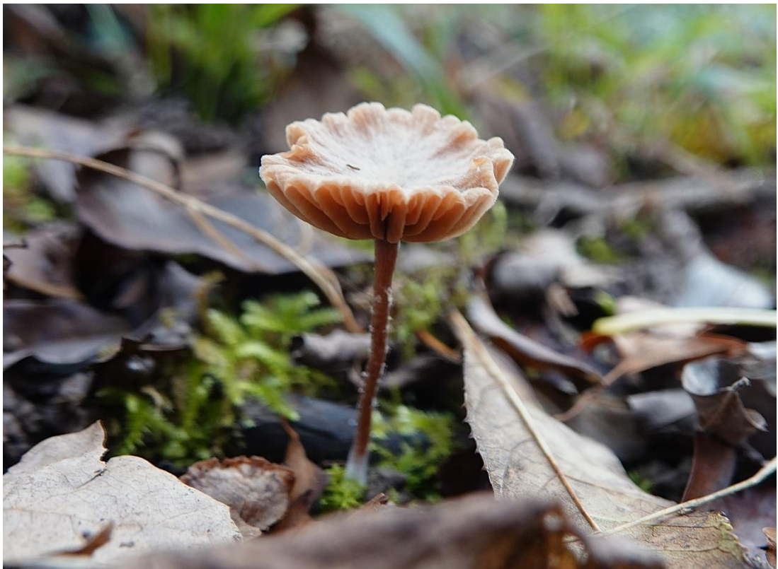
Tubaria conspersa (Pers.) Fayod, 1889 Tubaire voilée - Tubaire floconneuse - Agaricales - Tubariaceae