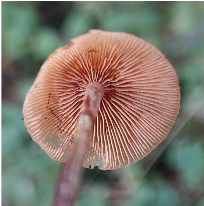
Galerina marginata (Batsch) Kühner, 1935 Galère marginée - Pholiote marginée - Agaricales - Cortinariaceae