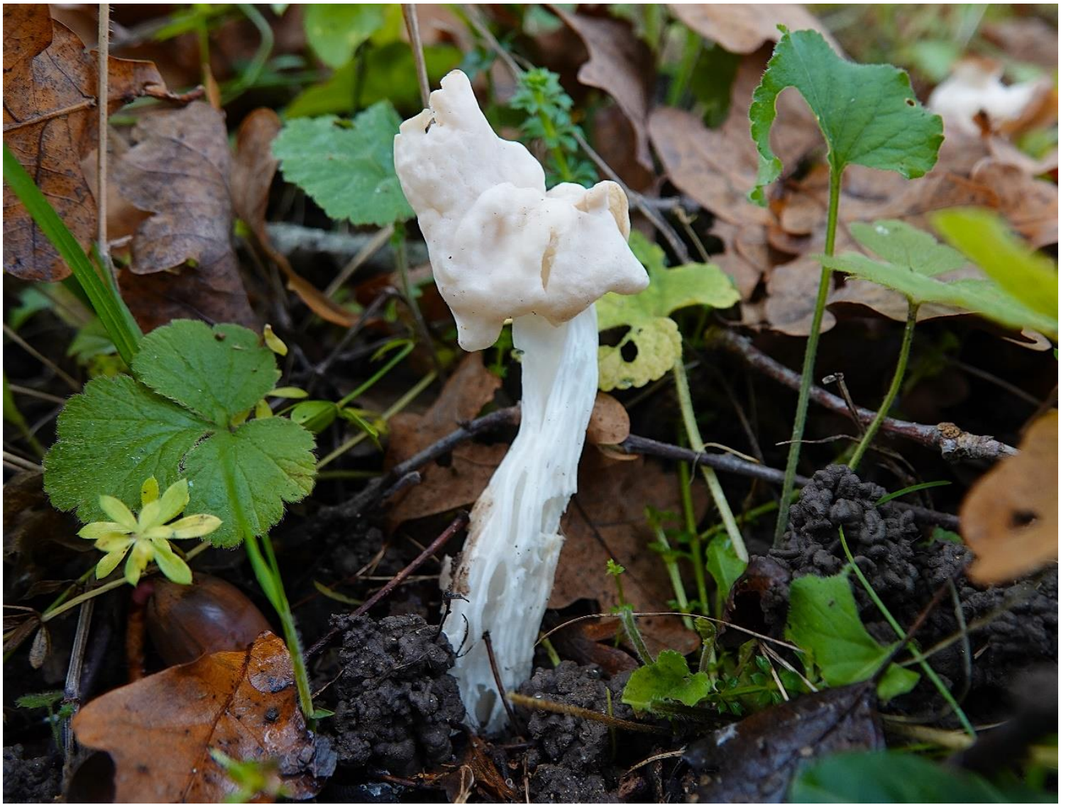
Helvella crispa (Scop.) Fr., 1822 - Helvelle crêpe - Pezizales - Helvellaceae