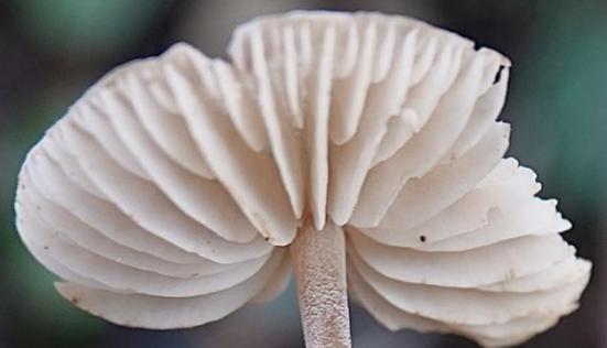
Mycenella bryophila (Voglino) Singer, 1951 Mycènes des mousses - Tricholomatales - Mycenaceae