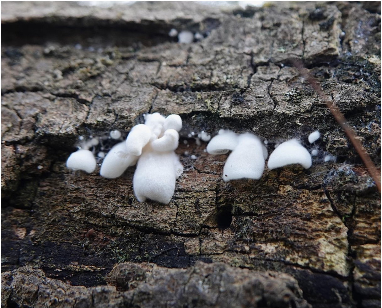
Clitopilus hobsonii (Berk.) P.D. Orton, 1960 Clitopile sessile - Entolomatales - Entolomataceae