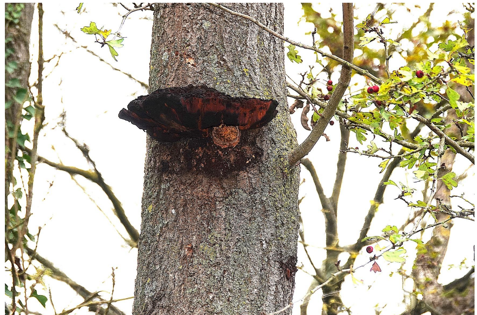
Inonotus hispidus (Bull.) P. Karst., 1879 Polypore herissé - Hymenochaetales - Hymenochaetaceae

Sous le polypore, présence d'un trou réalisé dans un Frêne par un Pic épeiche