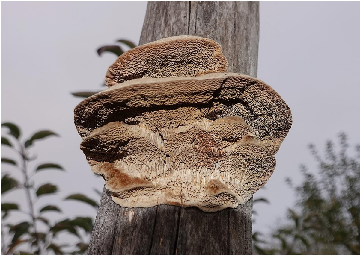
Funalia gallica (Fr.) Bondartsev & Singer, 1941 Synonyme : Coriolopsis gallica (Fr.) Ryvarden, 1973 Tramète des gaules - Polyporales - Polyporaceae