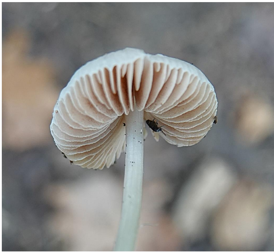
Pluteus boudieri P.D. Orton, 1960 (gr. plautus ) Plutée de Boudier - Pluteales - Pluteaceae