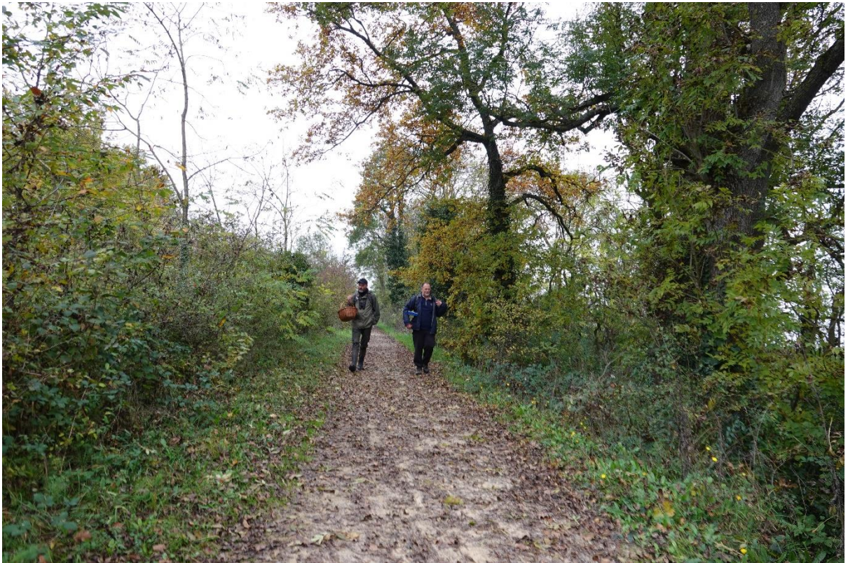
Prospection mycologique effectuée aux alentours du canal du Rhône au Rhin entre l'écluse située à côté de la Maison de la nature et la passerelle-observatoire.