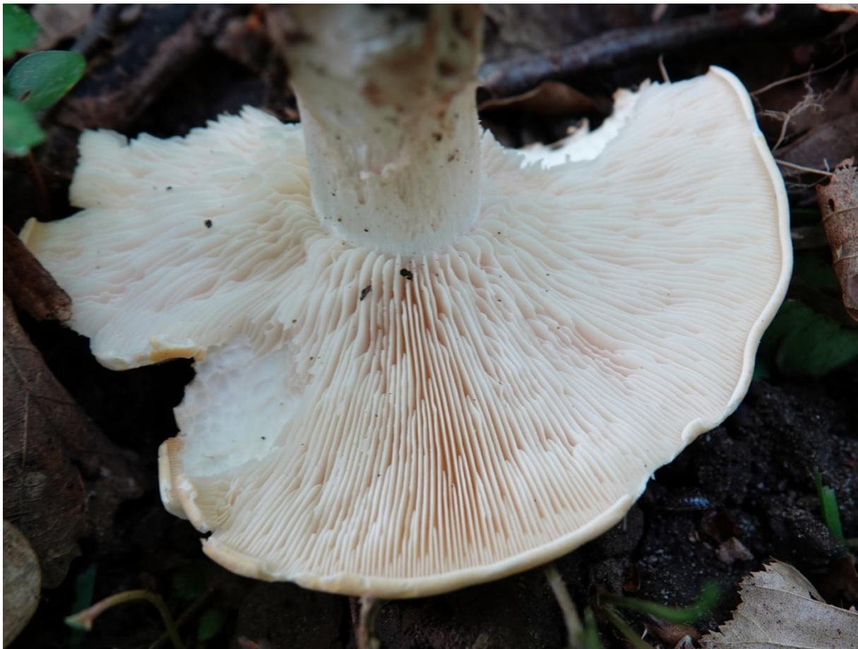
Calocybe gambosa (Fr.) Donk, 1962 Tricholome de la Saint-Georges - Mousseron de la Saint-Georges Tricholomatales - Lyophyllaceae