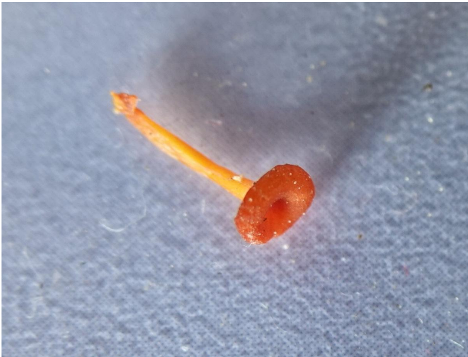
Rickenella fibula (Bull.) Raithelh., 1973 Omphale bibelot - Omphale épingle - Omphale aiguille Agaricales - Tricholomataceae