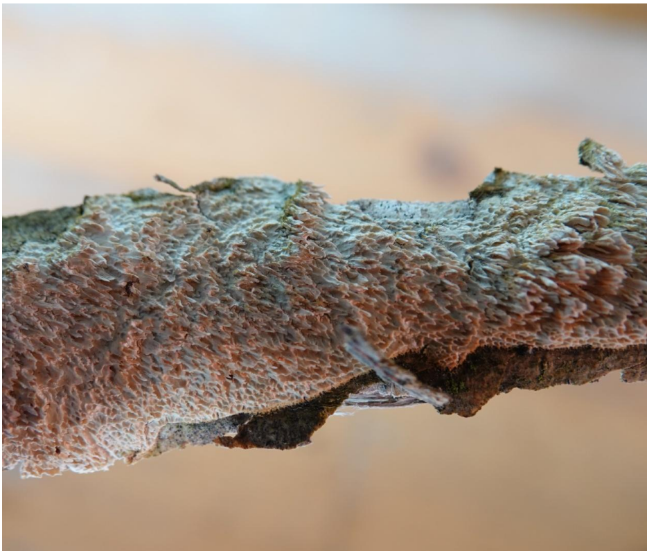
Schizopora paradoxa (Schrad.) Donk, 1967 Hymenochaetales - Schizoporaceae