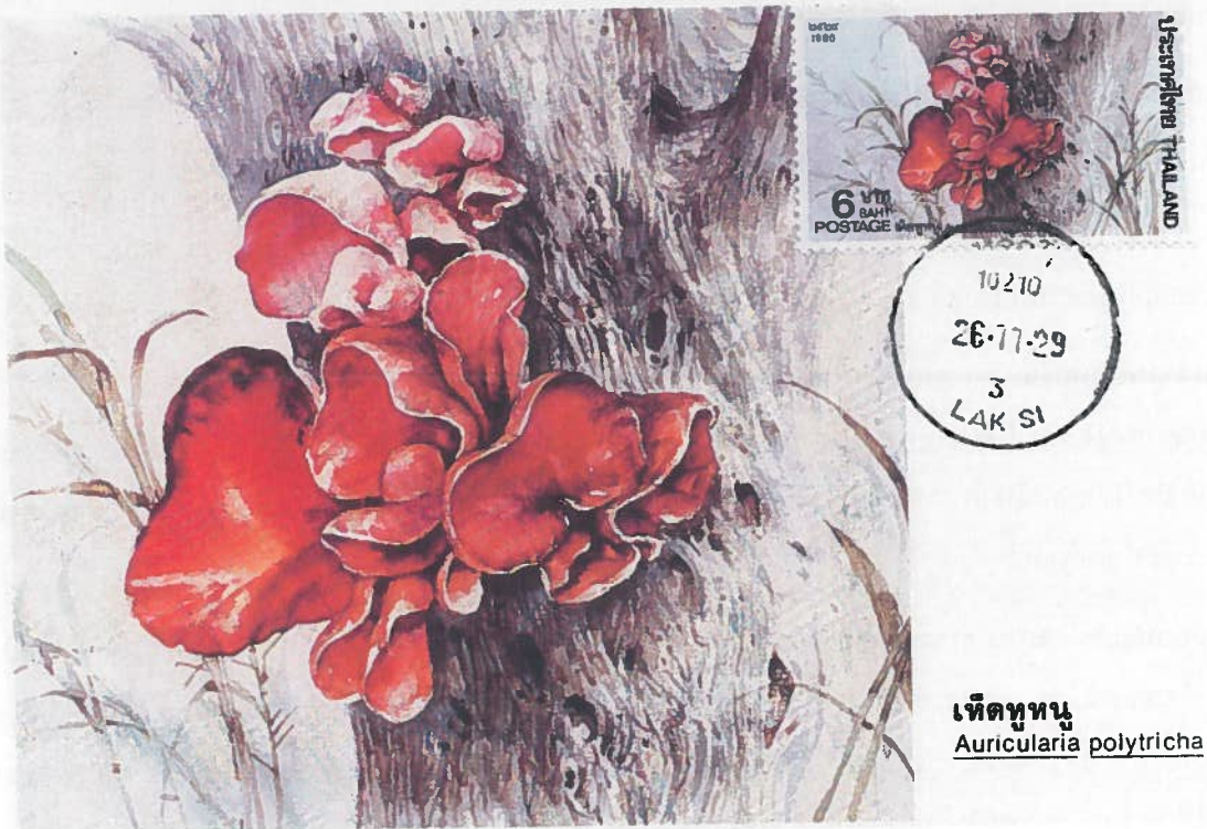
Auricularia polytricha - Thaïlande

http://fr.groups.yahoo.com/group/Mycophilie/