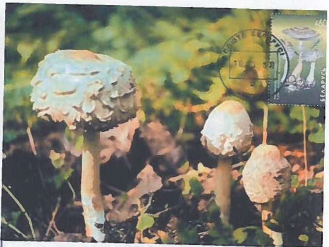
Macrolepiota rhacodes Bielorussie 1999