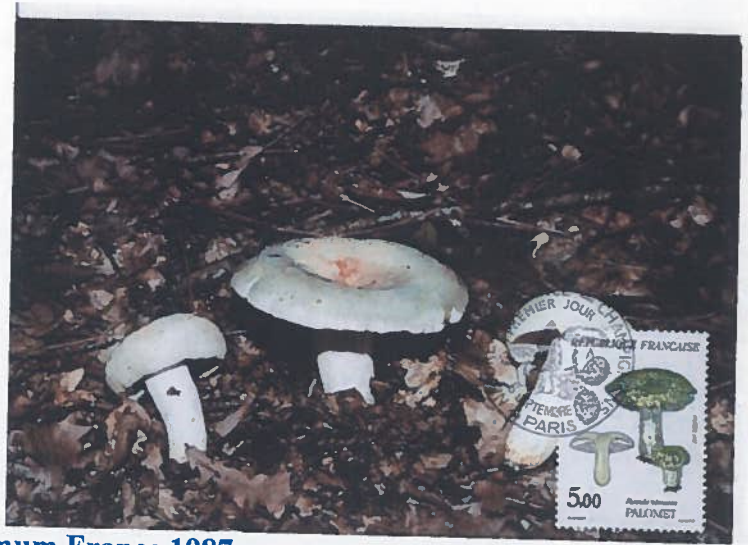
4 cartes maximum France 1987