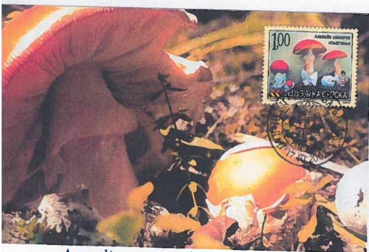
Amanita caesarea Serbie 2002