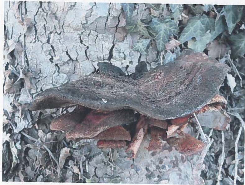
Inonotus cuticularis (Bull.) P. Karst

Fructification en console étagée largeur 23 cm et 13 cm en projection. Epaisseur au point d'attache 5 cm. Surface piléique jaunâtre au début, puis brun roux, hispide, feutrée veloutée. Marge aigue subulsi. Face inférieure finement porée, ocre brunâtre. Tubes longs (4 - 12 mm), unistratifiés. Trame mince molle et aqueuse au frais devenant dure et cassante à l'état sec.