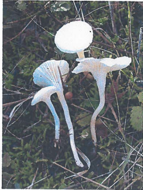
Cuphophyllus angustifolius ↗

Ce bel hygrophore, à chapeau jaune pâle ne connaît que le Mélèze comme compagnon.