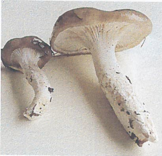
Hygrophorus latitabundus ↗

La couleur blanc pur du chapeau, les lames longuement décurrentes etc. sont quelques caractères de cette espèce nommée C. virgineus par certains auteurs