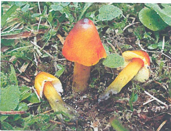
↖ Hygrophorus pseudoconica

Cette espèce des feuillus thermophiles calcicoles, très charnue, a le chapeau taché de rose vineux.