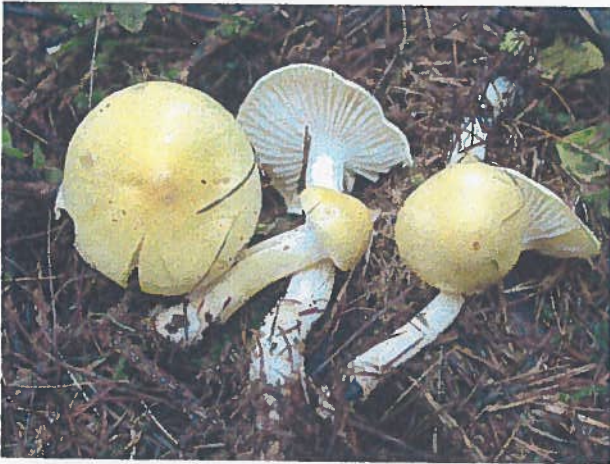
Hygrophorus lucorum ↗

Ce bel hygrophore, à chapeau jaune pâle ne connaît que le Mélèze comme compagnon.