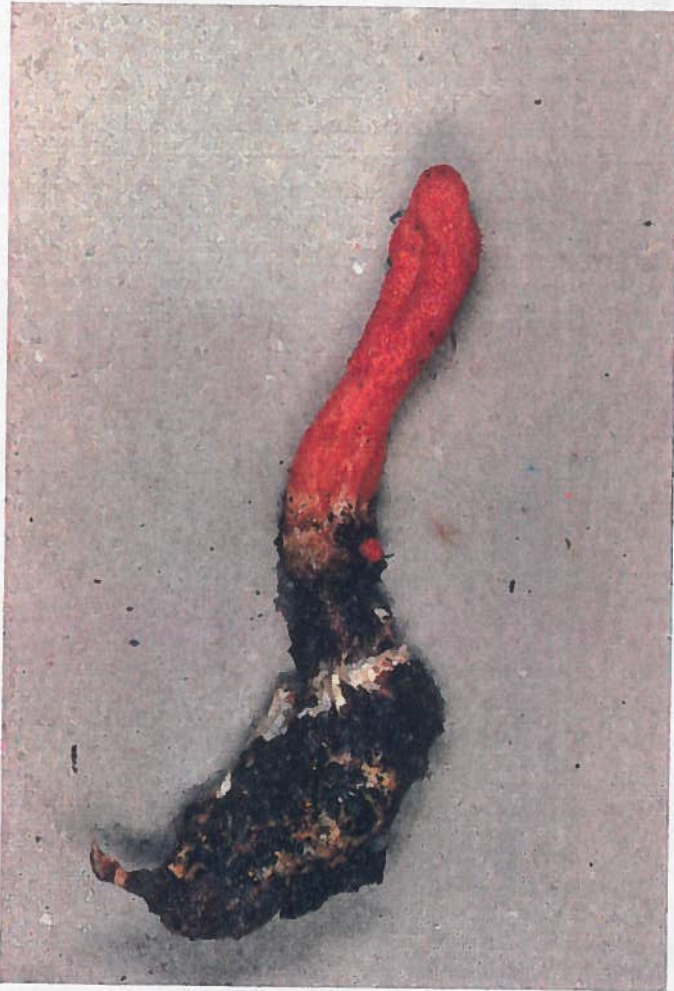
Cordyceps militaris avec support (Grandissement 1,5 x)