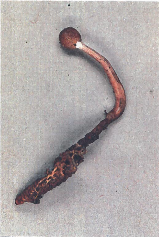
Cordyceps gracilis avec le support (Grandissement 2,5 x)